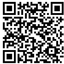
RICARDO HERIBERTO DIAZ CORTES Gobernador de la Región de Antofagasta GOBERNADOR REGIONAL

Documento firmado con Firma Electrónica Avanzada Documento original disponible en: https://goreantofagasta.ceropapel.cl/validar/?key=20989557&hash=be121